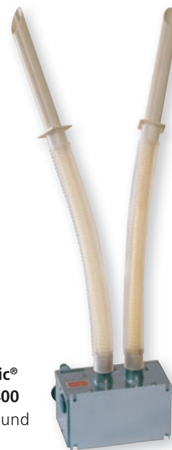
STULZ UltraSonic® Befeuchter FN 400 Für Klimageräte und Gebläsetruhen