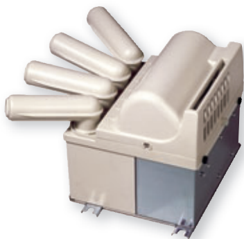
STULZ UltraSonic® Befeuchter KNB Für Gewächshäuser, Gemüse-, Obst- und Spargellager, Pilz-/Champignonzucht etc.