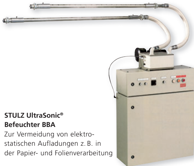
STULZ UltraSonic® Befeuchter BBA Zur Vermeidung von elektro-statischen Aufladungen z. B. in der Papier- und Folienverarbeitung