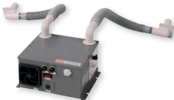
STULZ UltraSonic® Befeuchter SCA Für punktuelle Universalbefeuchtung